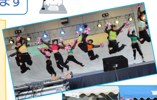
たかとり夏フェス2023

今年も昨年と同様、ダンスコンテストを中心に楽しい企画を考えています。詳しい内容が決まりましたら、「たかとり夏フェス 2023」のInstagramなどのSNSや高取まち協のホームページ(裏面に掲載)等で随時お知らせします。チェックしてくださいね (^_^)